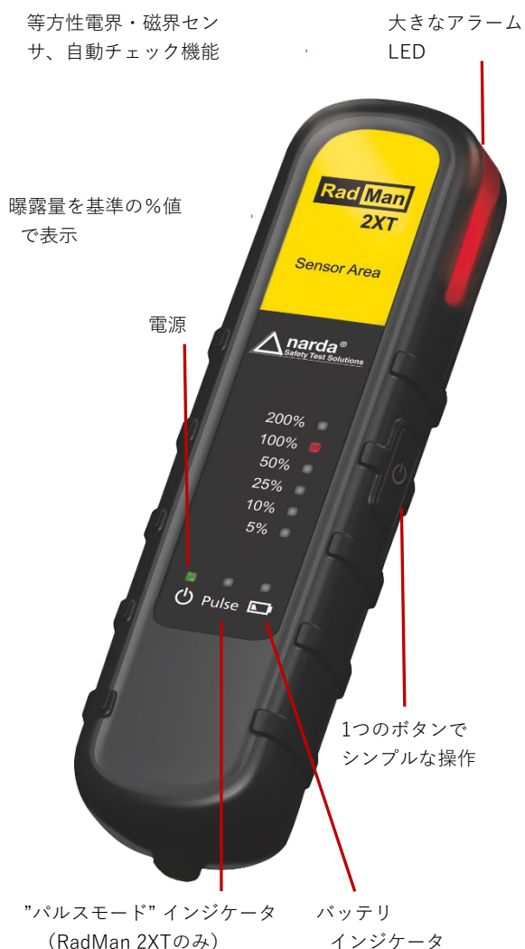
図1 前面、操作部とインジケータ

現在の曝露レベルは5%から200%の6段階のLEDで示されます。人体防護規格で定められた電力密度の限度値に対するパーセント値です。曝露レベルが基準の50%を超える場合、機器はバイブレーションとアラーム音を発します。RadMan 2の最上部には大きく明るいライトがあり、様々な角度から視認することができます。ライトはアラーム信号で赤く点滅します。基準の100%を超えるとアラーム音は鳴り続け、ユーザに危険区域から離れるよう警告します。