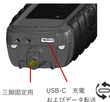
図2 カバーを開けた状態

新たに開発されたセンサテストにより正確な測定ができます。RadMan 2の電源を入れる度に各センサのチェックを行います。測定を行う前にテストジェネレータでチェックする必要はありません。